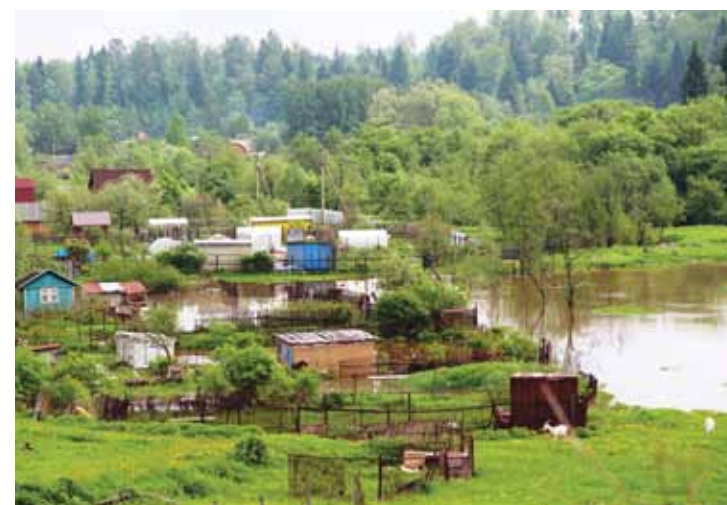
24 мая. Разлив р. Молодильни в д. Кострово.