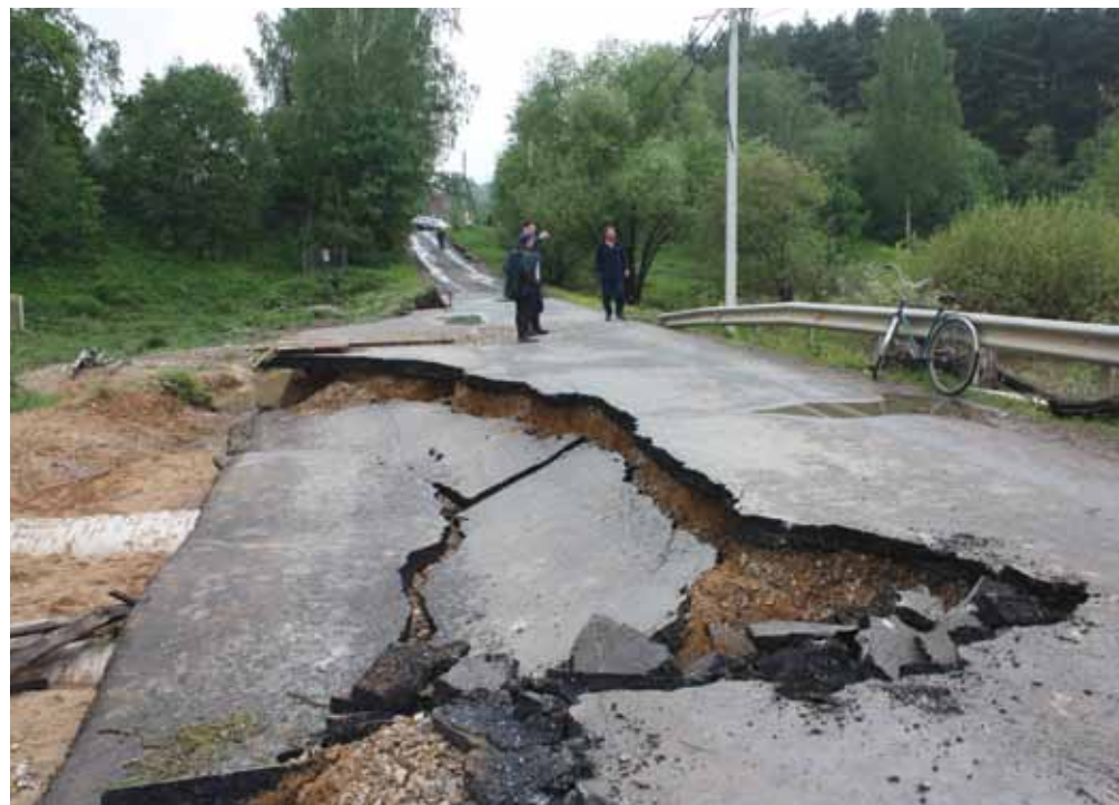
24 мая. Дедовск, дорога над р. Грязевой