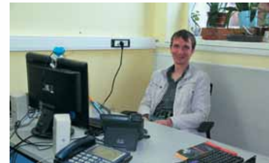
Наши специалисты работают днем и ночью.

реальные ip-адреса и доступ к городским камерам и архивам видеозаписей, дает возможность управления услугами (такими, как «Обещанный платеж» и смена тарифа), не выходя из дома, через «Личный кабинет». Одним из направлений нашей деятельности является оказание услуг по подбору программ для автоматизации бухгалтерского учета («Инфо-Бухгалтер» и «1С Предприятие 8»). Для юридических лиц также будет интересна наша услуга «Многоканальный номер и виртуальная АТС».