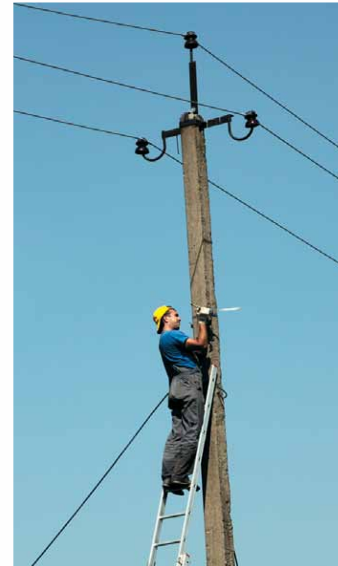
Монтажникам «Истранет» подвластна любая высота!

И ЭТО НЕ ВСЕ! МЫ РЕГУЛЯРНО (НЕ РЕЖЕ, ЧЕМ РАЗ В ПОЛГОДА) СНИЖАЕМ ЦЕНЫ НА НАШИ ТАРИФЫ КАК ЮРИДИЧЕСКИМ, ТАК И ФИЗИЧЕСКИМ ЛИЦАМ. А ЕЩЕ МЫ ПОДКЛЮЧАЕМ ТЕЛЕФОНИЮ, РАЗРАБАТЫВАЕМ И ИЗГОТОВЛИВАЕМ САЙТЫ, БЕСПЛАТНО ПРЕДОСТАВЛЯЕМ ПОЧТОВЫЕ ЯЩИКИ НА НАШИХ СЕРВЕРАХ (ISTRANET.RU, DEDOVSK.RU, GLEVOVKA.RU), А ТАКЖЕ УСЛУГИ ХОСТИНГА И IPTV. И МЫ НЕ СОБИРАЕМСЯ ОСТАНАВЛИВАТЬСЯ НА ДОСТИГНУТОМ! НА САЙТЕ ИСТРА.РФ МЫ ОПУБЛИКОВАЛИ ЦЕЛУЮ СЕРИЮ КОРОТКИХ ИНФОРМАЦИОННЫХ МАТЕРИАЛОВ ПОД ОБЩИМ НАЗВАНИЕМ «ПОЧЕМУ ИСТРАНЕТ ЛУЧШЕ?». ИЗ НИХ ВЫ СМОЖЕТЕ ПОЧЕРПНУТЬ ПОДРОБНУЮ ИНФОРМАЦИЮ ОБО ВСЕХ НАШИХ ПРЕИМУЩЕСТВАХ, И, НАДЕЕМСЯ, КАЖДЫЙ ОТКРОЕТ ДЛЯ СЕБЯ НОВЫЕ ВОЗМОЖНОСТИ, КОТОРЫЕ ПОМОГУТ УСПЕШНО РАБОТАТЬ, УЧИТЬСЯ – НУ, И РАЗВЛЕКАТЬСЯ, НАКОНЕЦ!