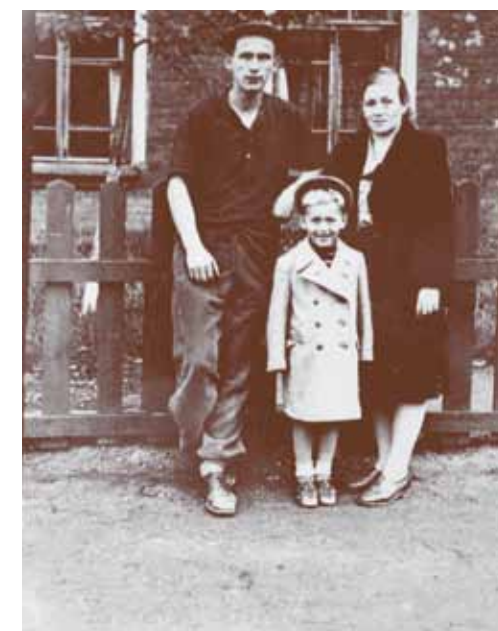
жители казармы.