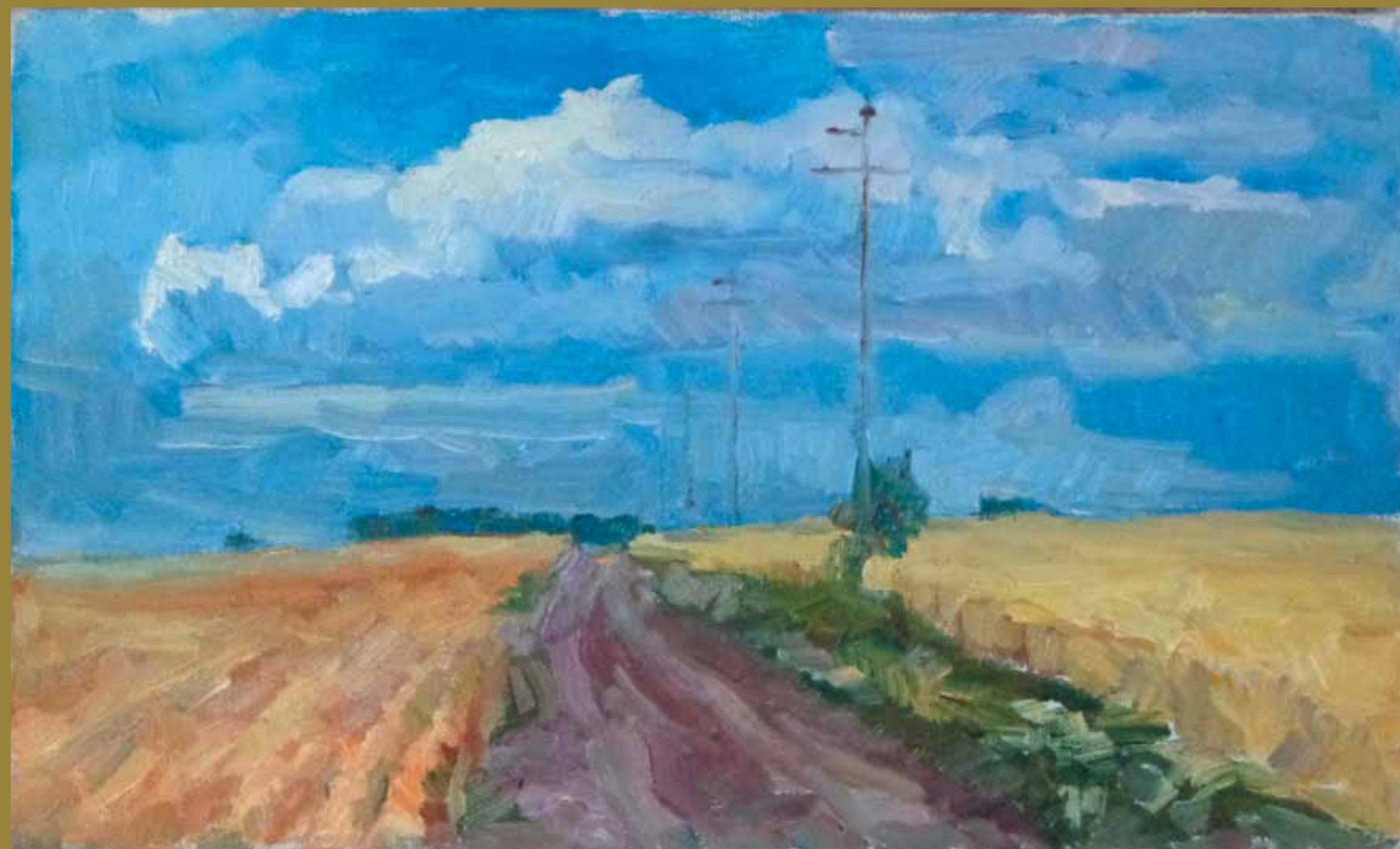
Среди хлебов. Этюд.