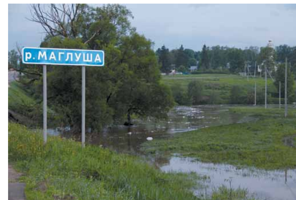
24 мая. Посёлок Глебовский.