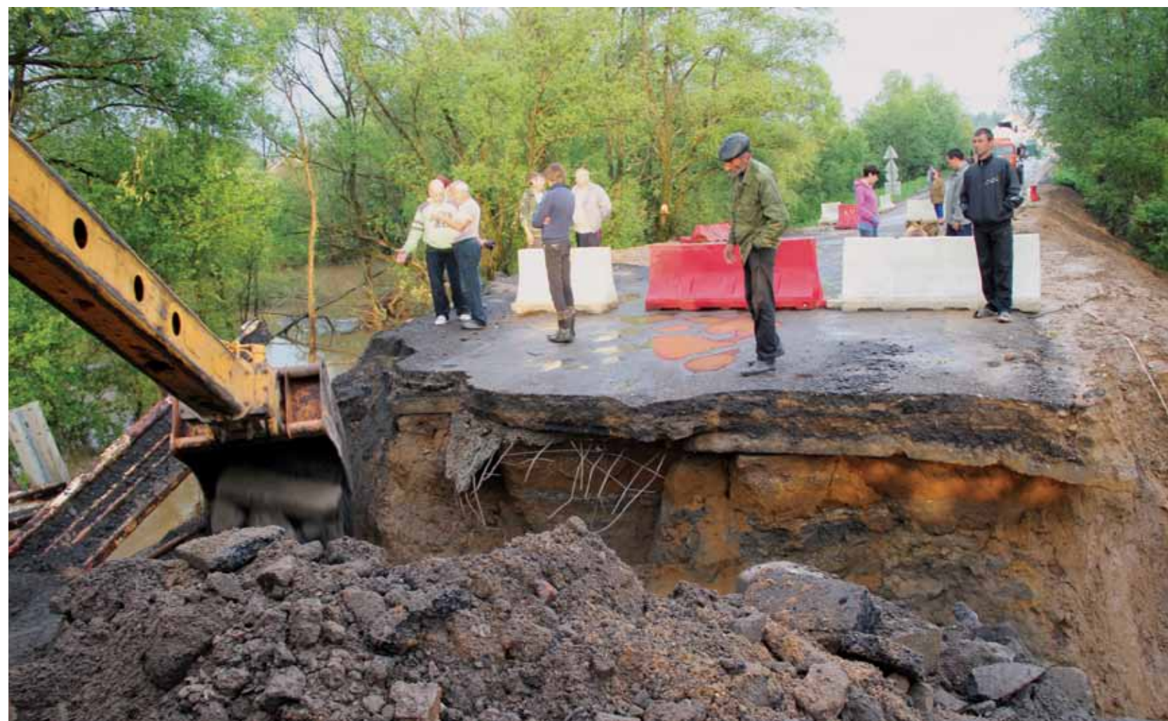
24 мая. Река Дарья во второй раз разрушила мост в Подпороино.