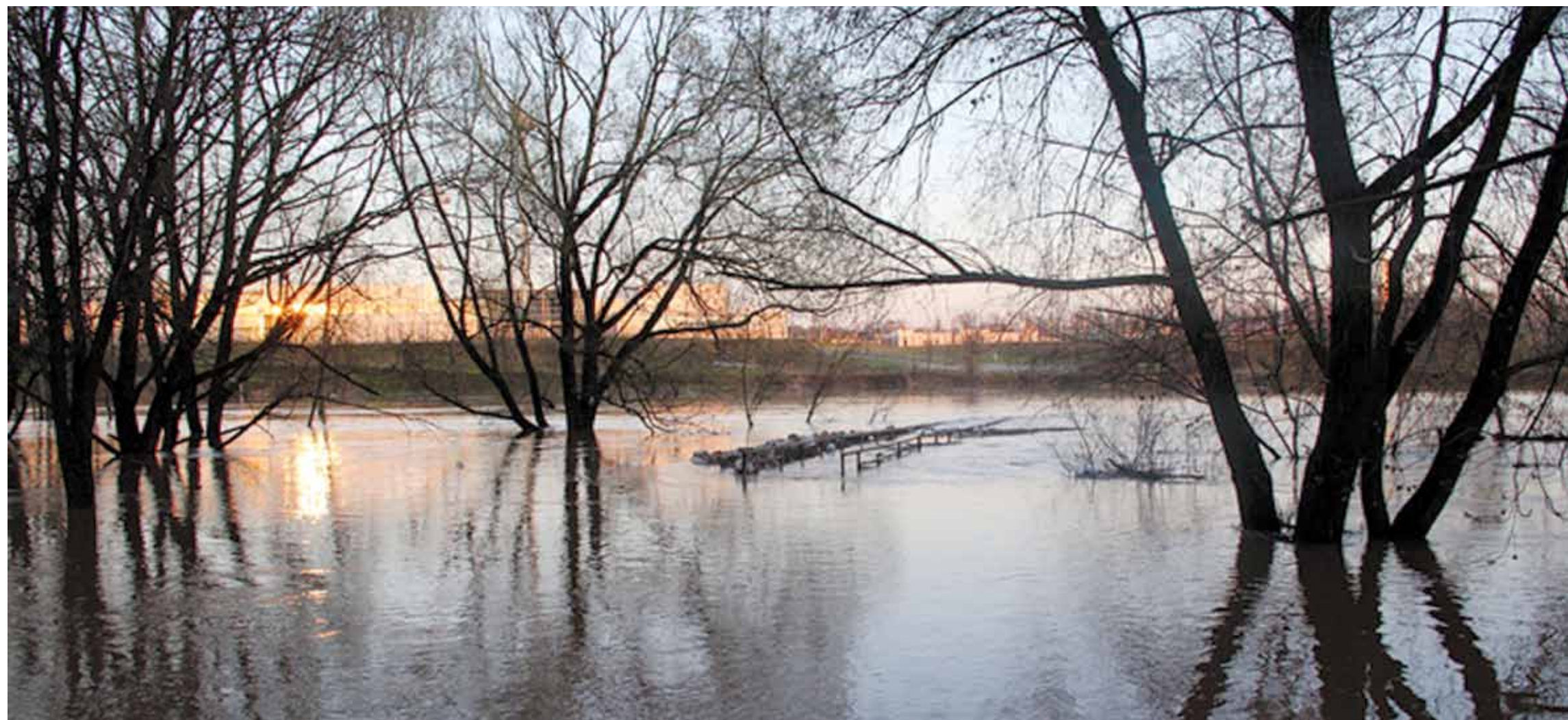
5 мая. Истра, мост над р. Песчаная