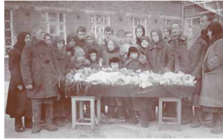
«Все у нас было общее: и свадьбы, и похороны, и горе, и радость. Настоящая пролетарская солидарность»

Помню первые дни, как мы начинали строить аэродром. Нас возили на машине в д. Высоково. Справа там большое поле. На нем был ложный аэродром. А с другой стороны, где