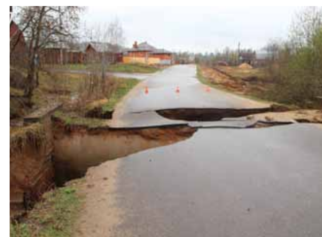
5 мая. р. Истра в Качаброво.