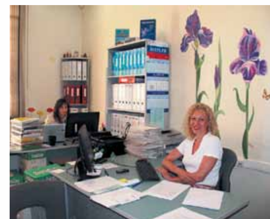
В нашем офисе всегда вам рады.