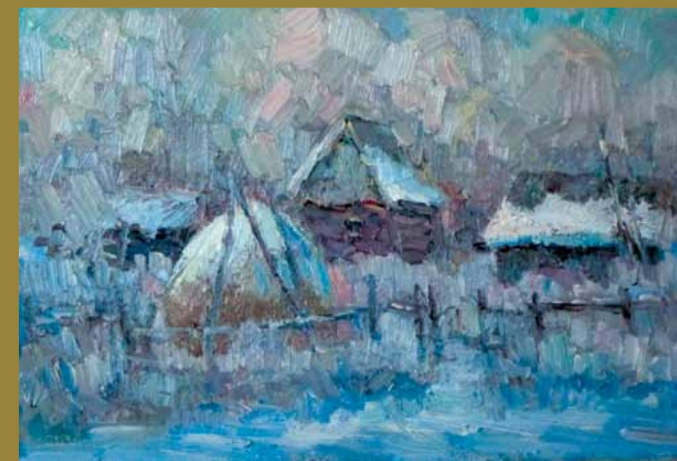
Зимний вечер. Этюд.