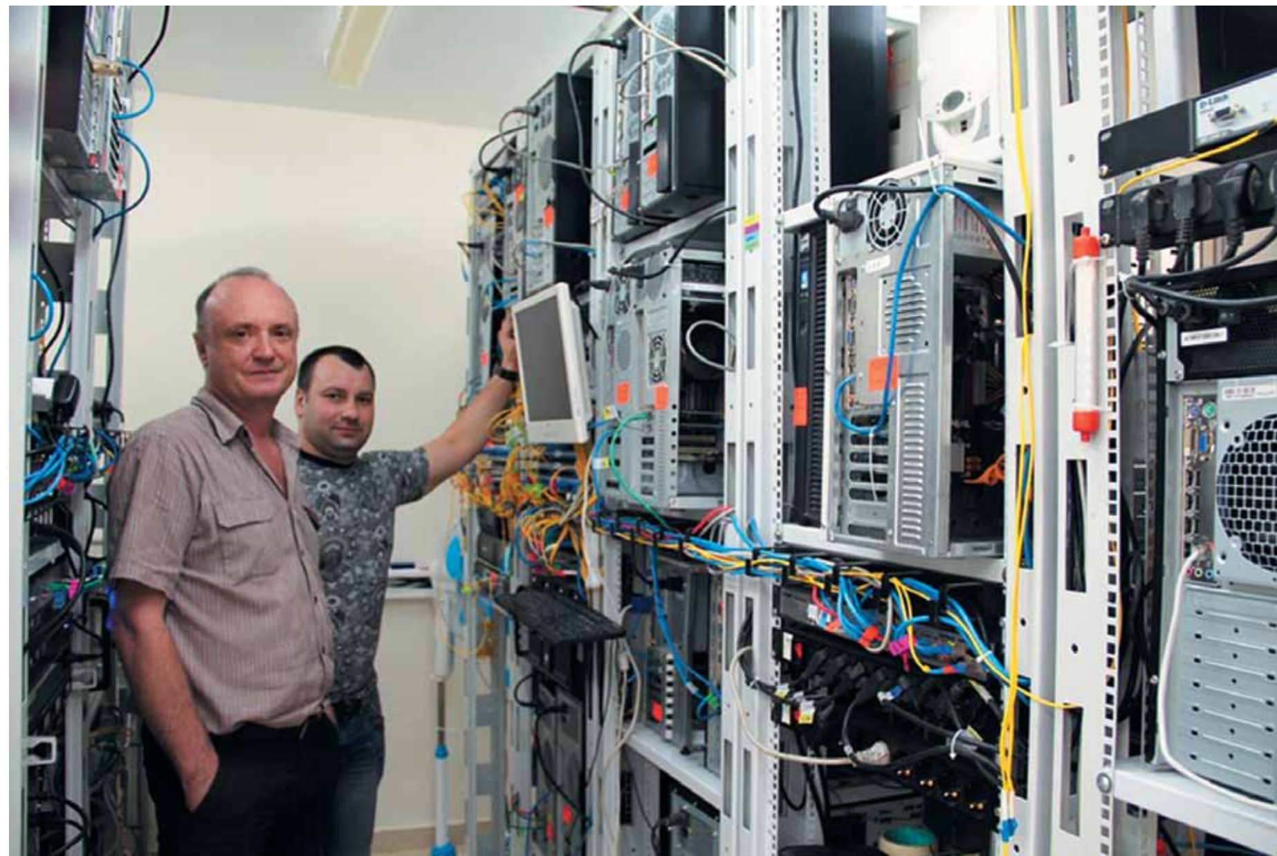
Серверная – «сердце Истранет»

Без лишней скромности можно сказать, что на сегодняшний день компания «Истранет» является лучшим провайдером. Многие абоненты знают, что, помимо простого предоставления доступа в Интернет, «Истранет» обладает широким спектром дополнительных услуг и возможностей. Однако опросы показали, что большинство пользователей и не подозревают, какими достоинствами обладает наша компания и какие возможности она открывает перед своими абонентами. Мы исправим этот недочет!