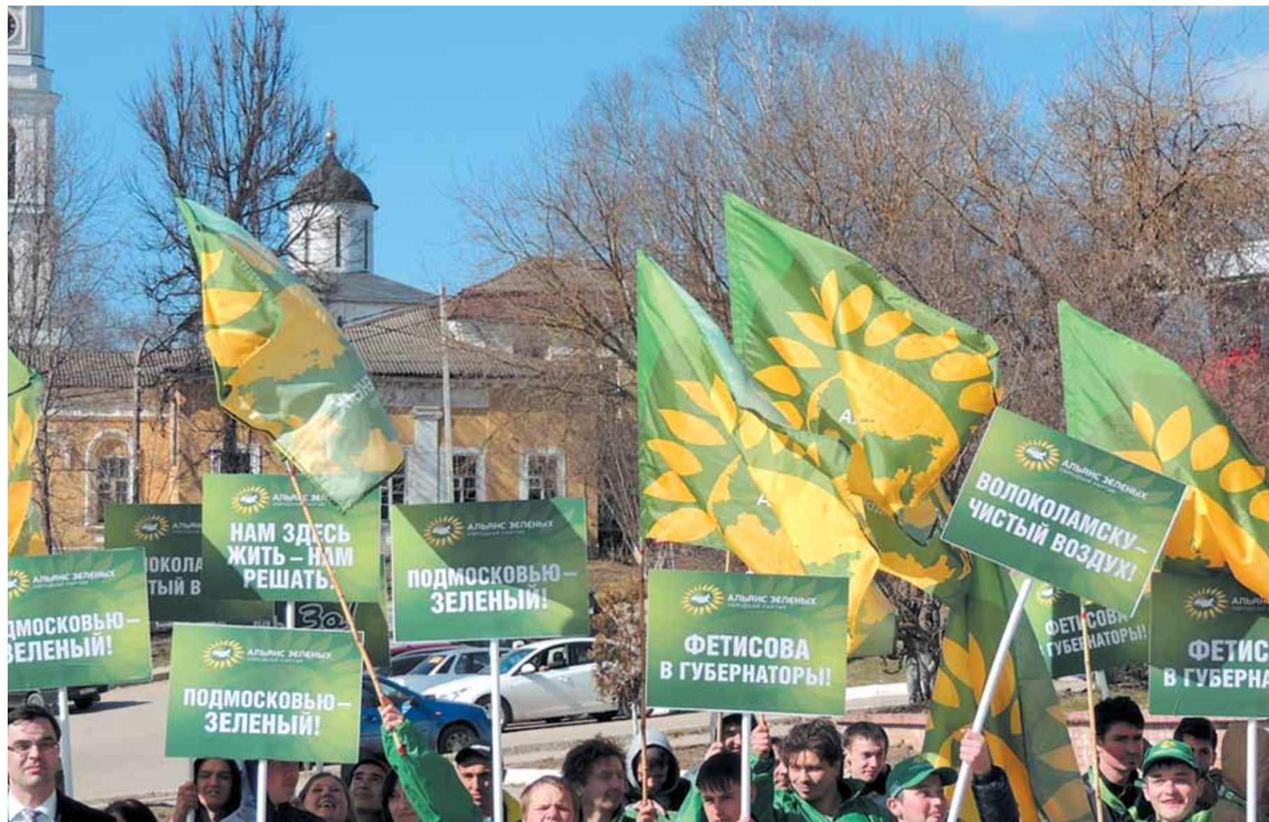
Митинг против генерального плана в Волоколамске 22 апреля 2013 года

МНЕ ВСЕ ВРЕМЯ ЗАДАЮТ ОДИН И ТОТ ЖЕ ВОПРОС: ПОЧЕМУ Я ХОЧУ БОРОТЬСЯ ЗА ПОСТ ГУБЕРНАТОРА МОСКОВСКОЙ ОБЛАСТИ. ЕСЛИ ЧЕСТНО, Я УЖЕ УСТАЛ НА НЕГО ОТВЕЧАТЬ. ВМЕСТО ЭТОГО Я ВСЕ ВРЕМЯ ЖДУ ДРУГОГО ВОПРОСА: ЗАЧЕМ Я ЭТО ДЕЛАЮ.